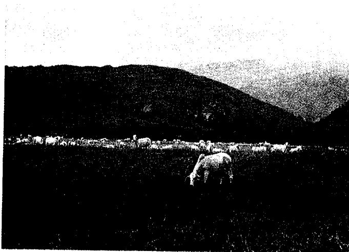
Las fincas del Valle del Cauca son empleadas en actividades de ganadería y agricultura.

Las empresas ganaderas son principalmente de grandes extensiones, 55% de las fincas son mayores de