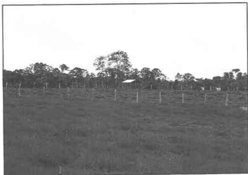
Foto 5. Pastura de Humidicola en el piedemonte de los Llanos Orientales de Colombia.

En la altillanura plana con una fertilización de 25 kg/ha de P, 30 kg/ha de K, 100 kg/ha de Ca y 25 kg/ha de Mg, la producción de Humidicola alcanzó 8300 kg/ha de materia seca, promedio anual.