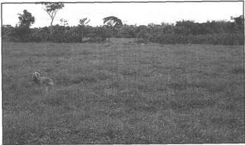
Foto 4. Pastura de Humidicola-Maní Forrajero Perenne en el piedemonte caqueteño.