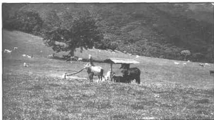
Foto 1. El pasto Humidicola soporta altas cargas animales en pastoreo.