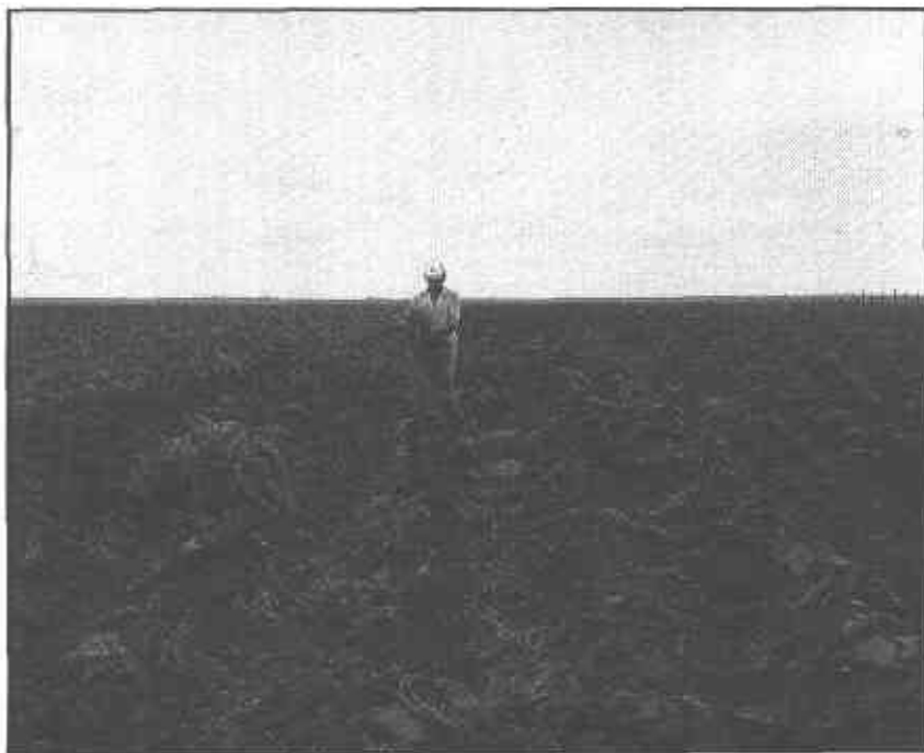
Foto 3. Siembra de pasto Humidicola con material vegetativo.

y Maní Forrajero Perenne constituyen excelentes alternativas para asociar con esta gramínea, debido a su buen desarrollo estolonífero, alta producción de semilla, tolerancia a la sombra y al pastoreo intenso, lo cual garantiza la persistencia de estas leguminosas en las pasturas (Foto 4). Las leguminosas pueden sembrarse al mismo tiempo que la gramínea, a voleo o en surcos alternos, con material vegetativo o con semilla.