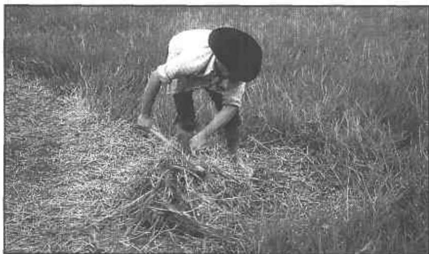
Foto 2. Material vegetativo para la multiplicación de pasto Humidicola.