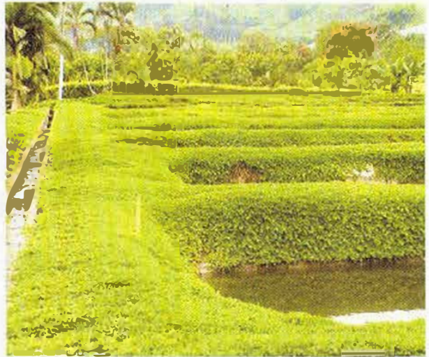
Foto 3. Cobertura vegetal en estanques piscícolas