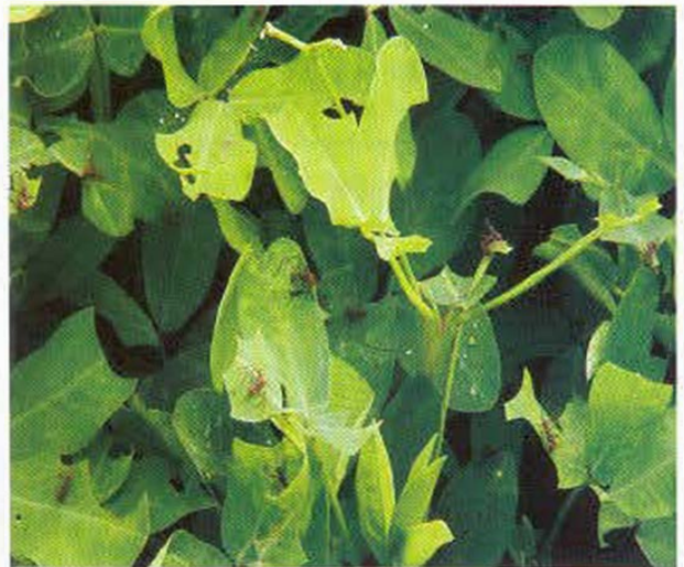
Foto 1. MFP deteriorada por hormigas.