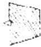
Siembra del brote