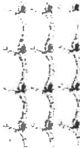
Unidades de planta