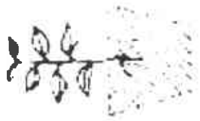
Planta procedente del brote