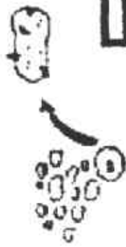
Tubérculos de una planta