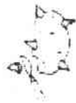
Corte del brote