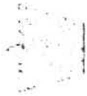
Siembra de un tubérculo seleccionado