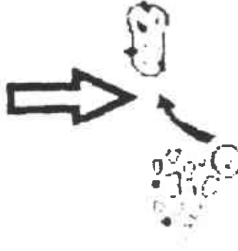
Siembra de tubérculos restantes