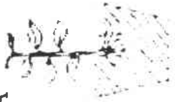
Planta procedente de tubérculo