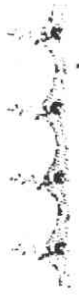
Siembra en unidades de tubérculo