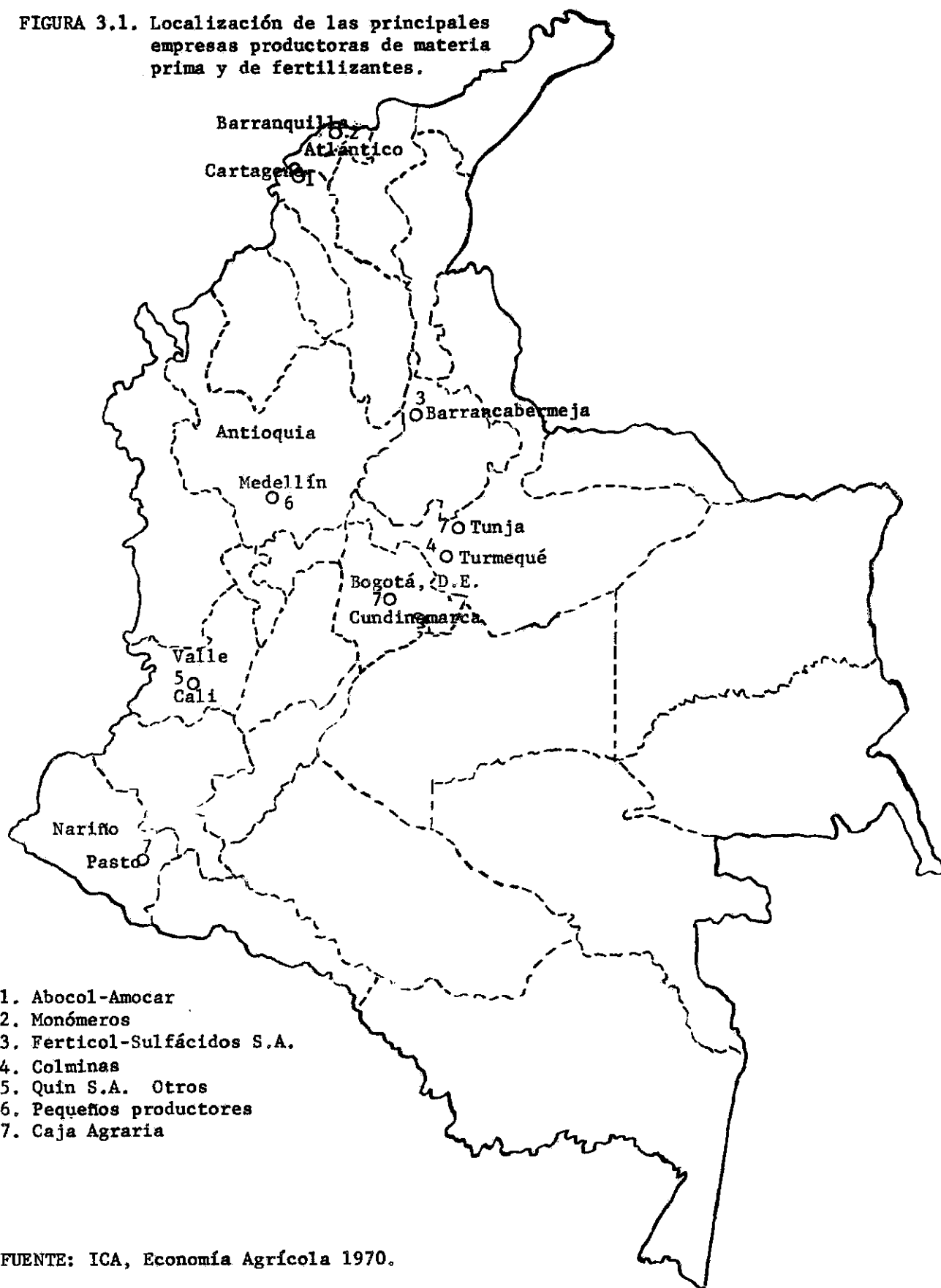
FIGURA 3.1. Localización de las principales empresas productoras de materia prima y de fertilizantes.