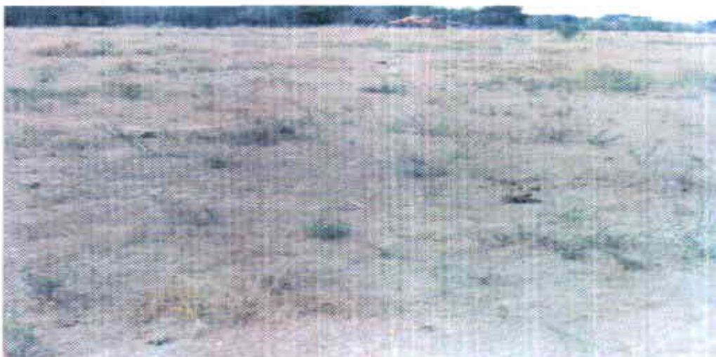
Figura 2. Estado de la finca antes de las técnicas de labranza en Aguachica, Cesar, 1998.