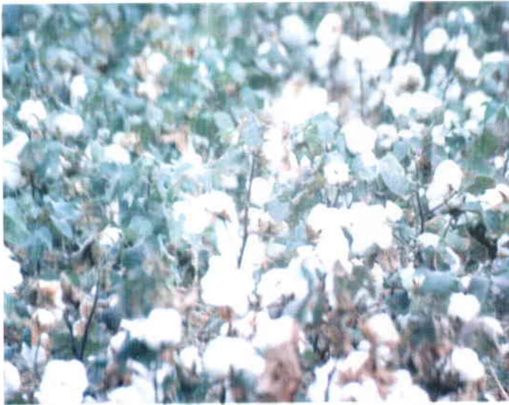
Figura 3. Lote de algodón en la finca de Aguachica a los dos años de mejoramiento del suelo.