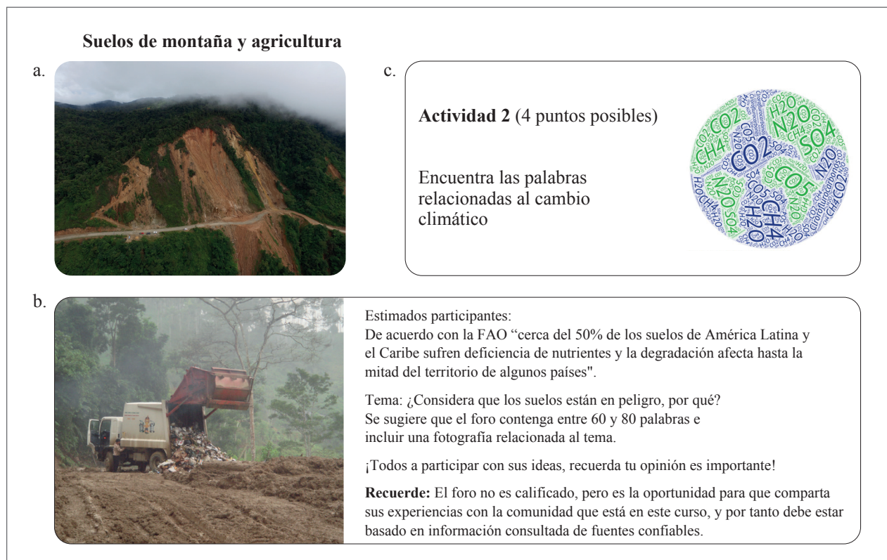
Figura 2. Actividades opcionales planteadas en la pestaña "Contenidos" del MOOC Manejo del Recurso Suelo. a. Video; b. Foro; c. Actividades recomendadas (juegos).