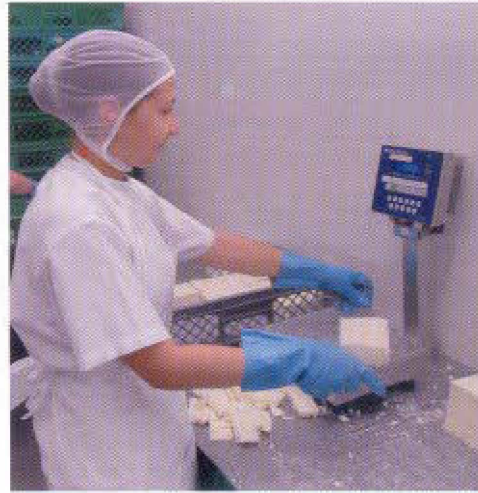
Pesaje del producto final

Luego de la pasteurización, se procede a descender la temperatura óptima de cuajado hasta los 28°C, máximo 30°C. Esta temperatura es clave para lograr tiempos óptimos de coagulación, asegurar la efectividad del cuajo y conceder la firmeza adecuada al producto, ya que si se cuaja a una temperatura elevada se obtiene una cuajada dura y elástica y a temperatura baja se produce una cuajada demasiado blanda (6) (9) (10).