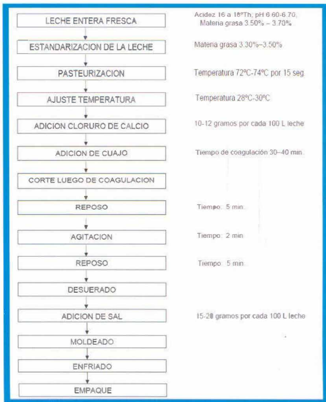
Diagrama 1. Flujograma proceso elaboración de la Cuajada.

En el Diagrama 1 se describen las diversas etapas en la fabricación de la cuajada.