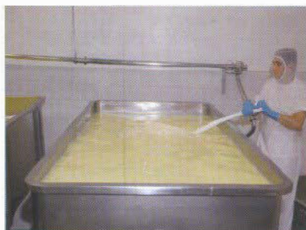
Proceso de agitación de los granos de Cuajada