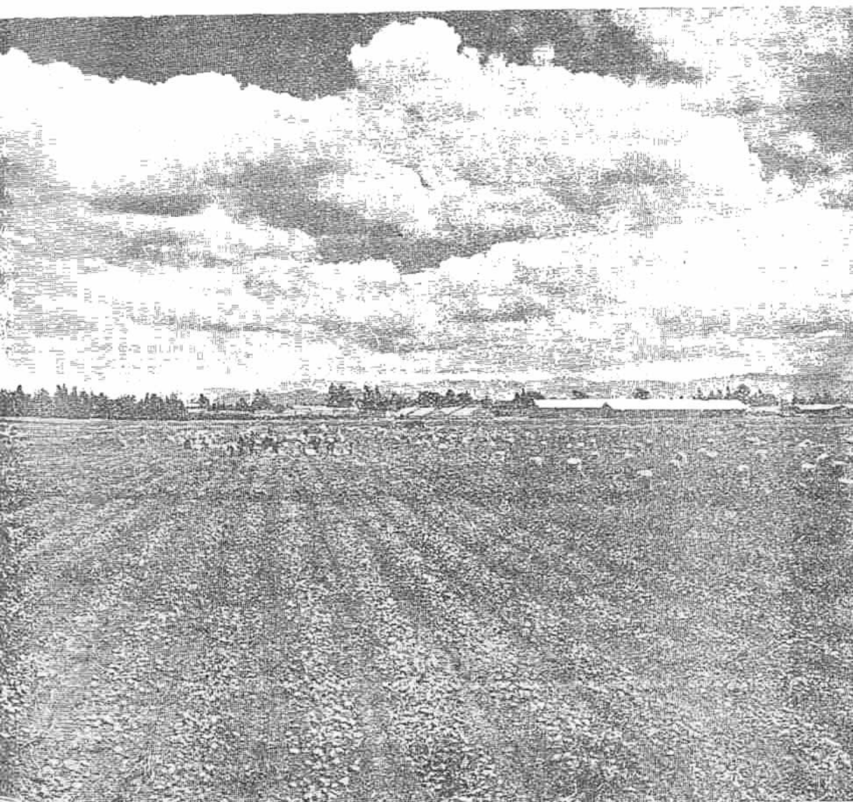
Fig. 2. - Cosecha en un lote de papa bien manejado en su cultivo.

Cuando se trata de producir semilla, se recomienda eliminar el follaje unos 15 a 20 días antes de lo indicado anteriormente con el fin de obtener más tubérculos de segunda o "pareja". Se hace necesario hacer "cateo" por planta para determinar el porcentaje de tubérculos tamaño "semilla".