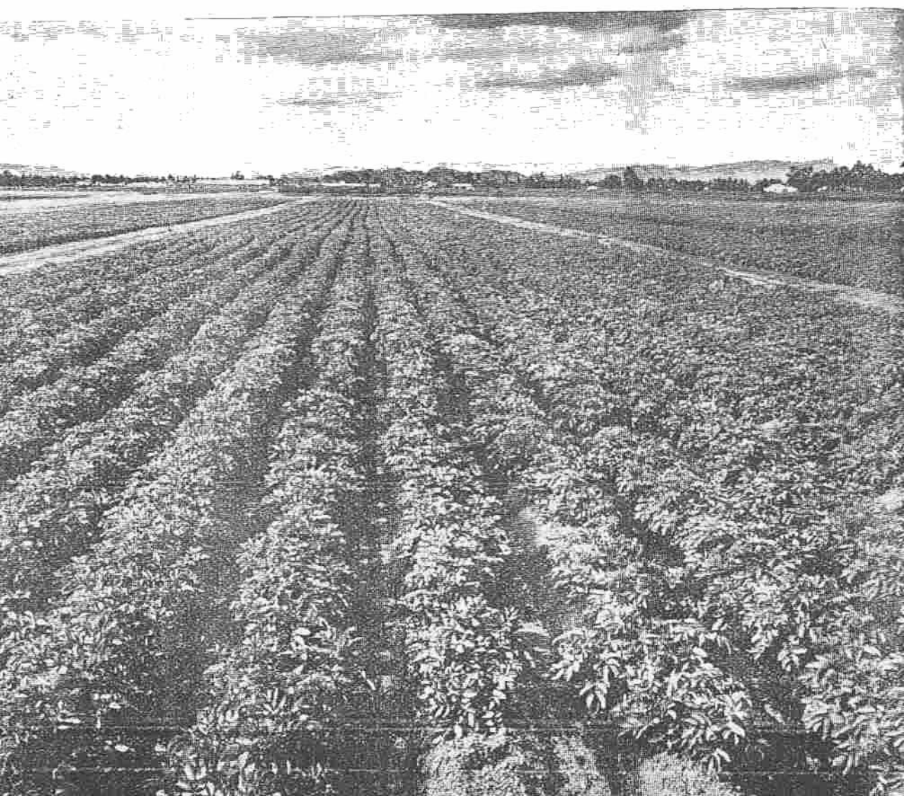
FIG. 1. - Un cultivo de papa sembrado a máquina en la edad adecuada para el aporque.

El aporque se hace arrimando tierra a lado y lado de las plantas hasta una altura de 20 a 30 centímetros sobre el suelo y tratando de que cuando los tubérculos lleguen a formarse y crecer, queden bien cubiertos. Debe hacerse antes de que las plantas alcancen demasiado crecimiento, 30 centímetros aproximadamente, con el fin de no lastimar demasiado las plantas. Puede hacerse con azadón o con máquina. Si fuere necesario, se hace un segundo aporque antes de la floración (Figura 1).