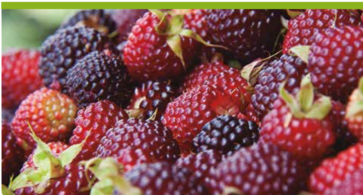
▲ Frutos de la mora de Castilla