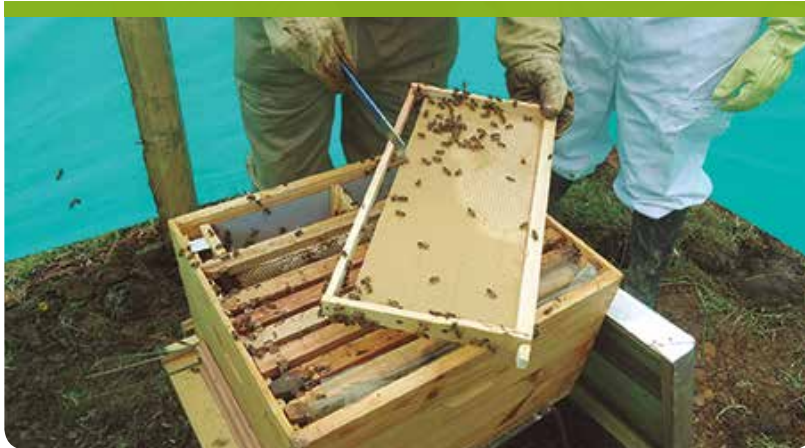
▲ Uso de la palanca para separar los paneles