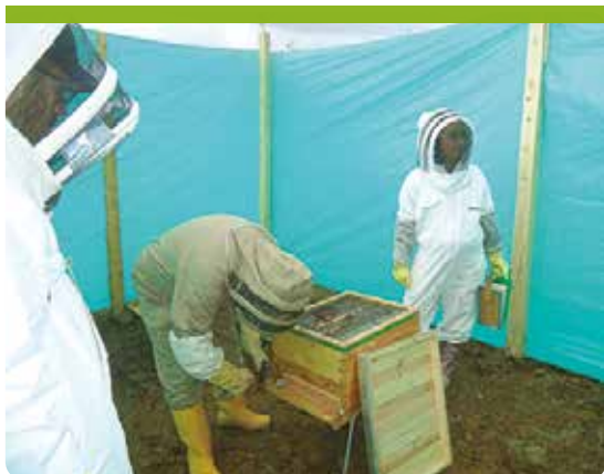
▲ Uso del ahumador para el manejo de abejas