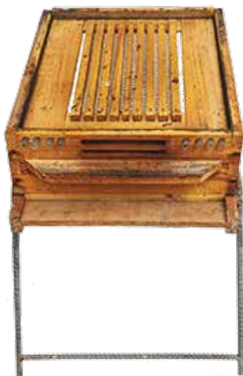
▲ Trampa de polen

Al coleccionar en la trampa una parte del polen que las abejas llevan a la colonia, estas detectan una “falta de polen” en su colmena y salen a pecorear con más frecuencia .