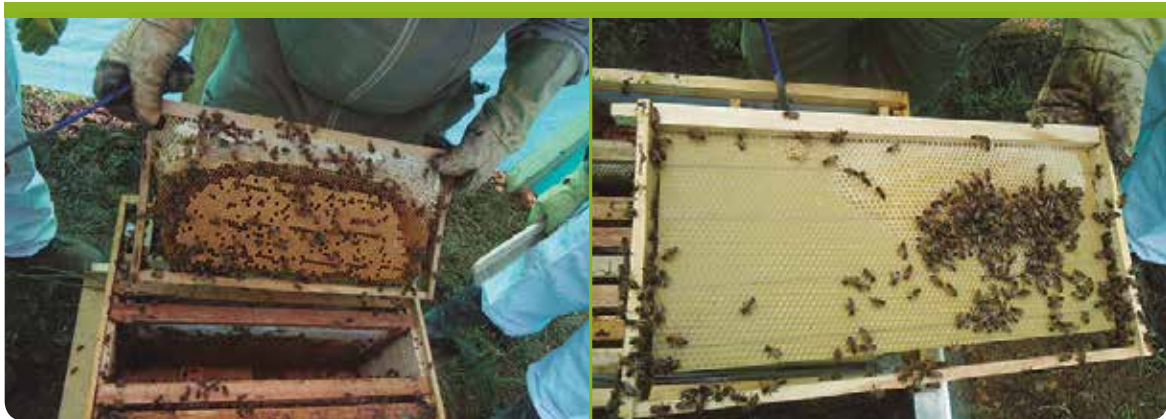
▲ Revisión de la colonia

Registre en una libreta los resultados de las revisiones junto con la fecha en que las hace, para que pueda hacer seguimiento y tome las medidas necesarias.