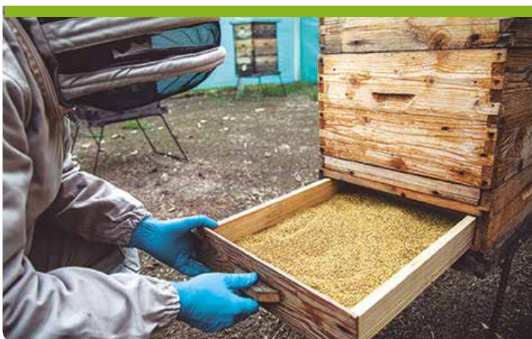
▲ Trampa con polen colectado