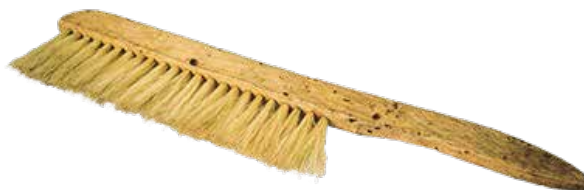
▲ Cepillo de cerdas suaves

Es importante que este cepillo tenga cerdas suaves para no lastimar a los insectos.