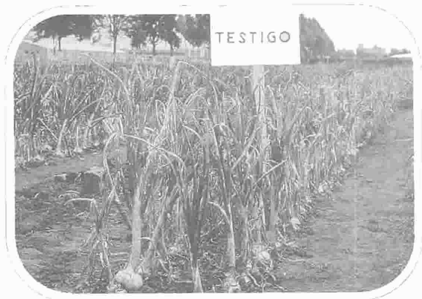
FIGURA 126 Cultivo de cebolla no tratado con fungicida, con fuerte ataque de enfermedades, especialmente A. spumosa , por "laguna superior". En la figura inferior se aprecia el excelente control obtenido con aplicación de fungo oxida.