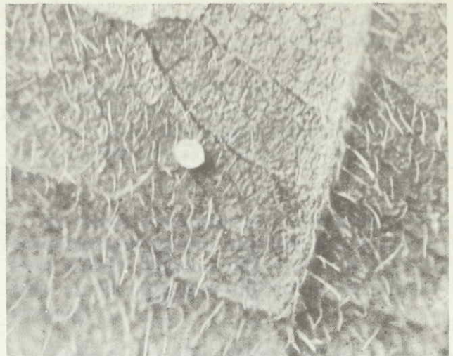
Figura 1. Huevo de A. gemmatalis . Nótese su forma redondeada.

Huevo: Son ligeramente redondeados (Figura 1) y planos en la base o superficie que va adherida a