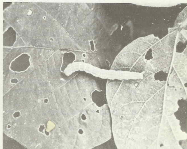
Figura 2. Larva de V instar de A. gemmatalis . Obsérvese las perforaciones en las hojas debido a su alimentación.

Una vez que las larvas finalizan su período de alimentación se desplazan hacia el suelo, en donde a una profundidad de 2 a 3 cm. inician la fabricación de la celda pupal.