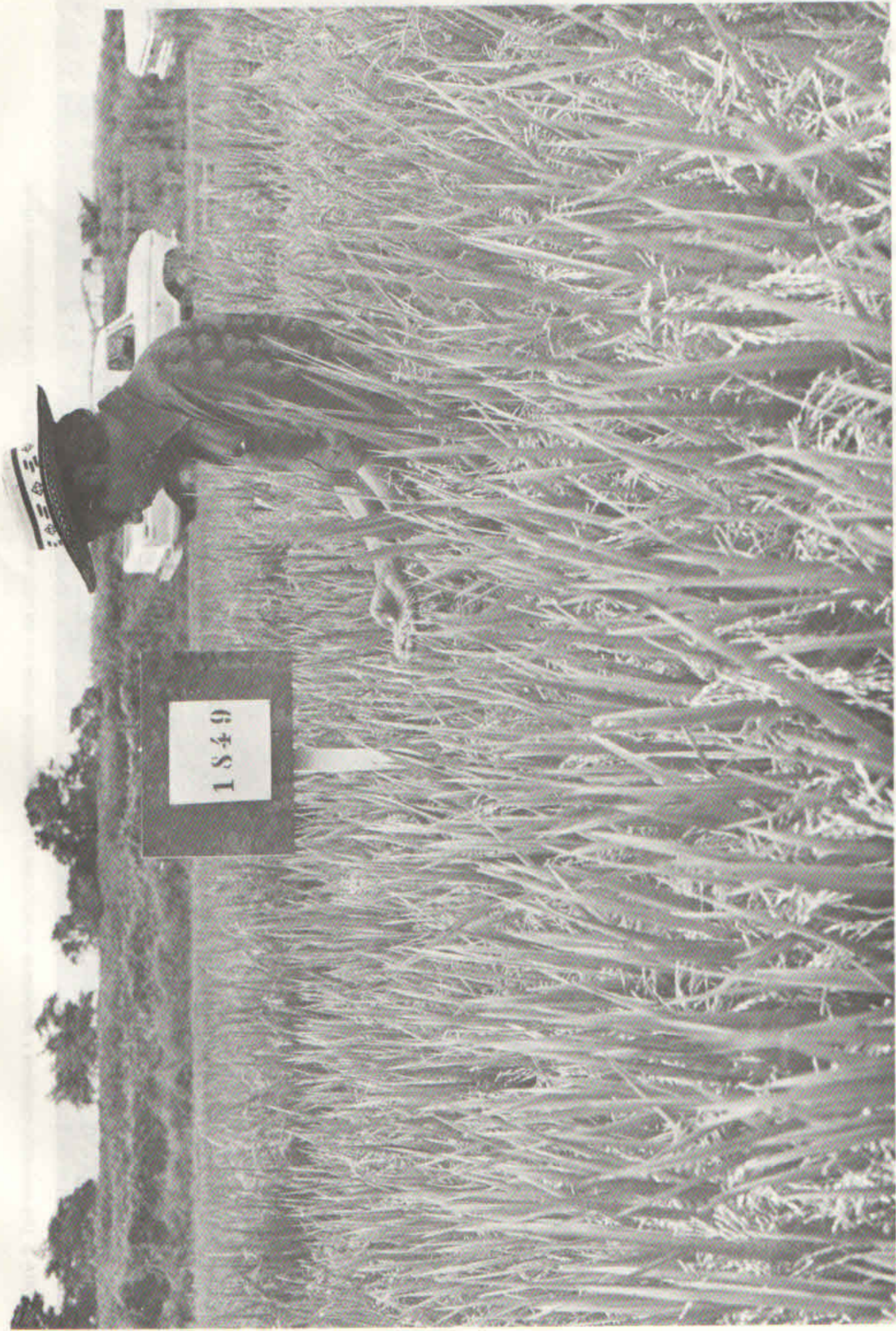
FIGURA 2. Las nuevas líneas promisorias se caracterizan por tener hojas cortas, erectas y verse hasta la maduración y una panícula larga y pesada.