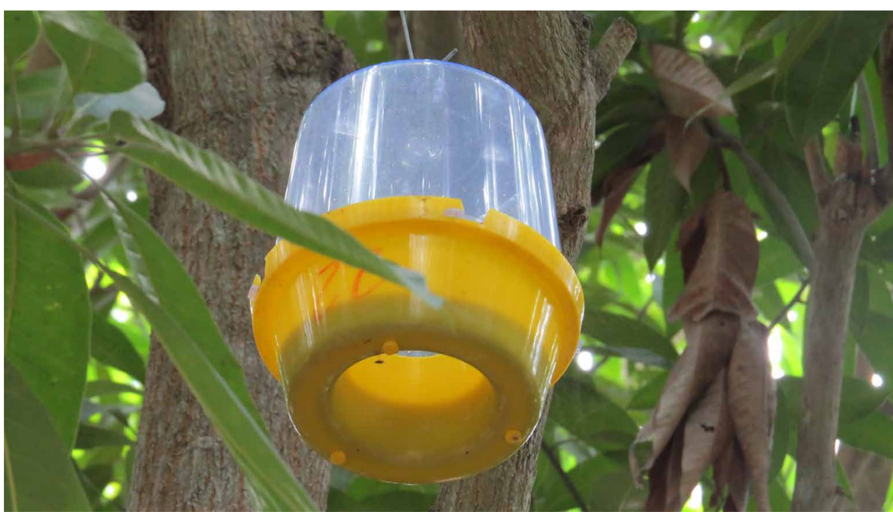
Figura 1. Trampa McPhail utilizada para el monitoreo de adultos de mosca de la fruta.

Se calculó el índice MTD utilizando trampas McPhail (Figura 1) cebadas con proteína hidrolizada, el número de trampas para cada predio varió según el área, entre 4 y 12 trampas, y se determinó siguiendo las recomendaciones del Instituto colombiano agropecuario (ICA).