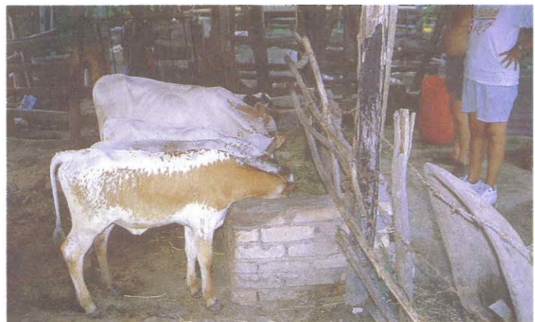
En el uso de pastos de corte se requiere una buena gestión administrativa

Un trabajador atiende todas las labores de la finca. Nosotros vivimos en ella desde hace siete años y pla-