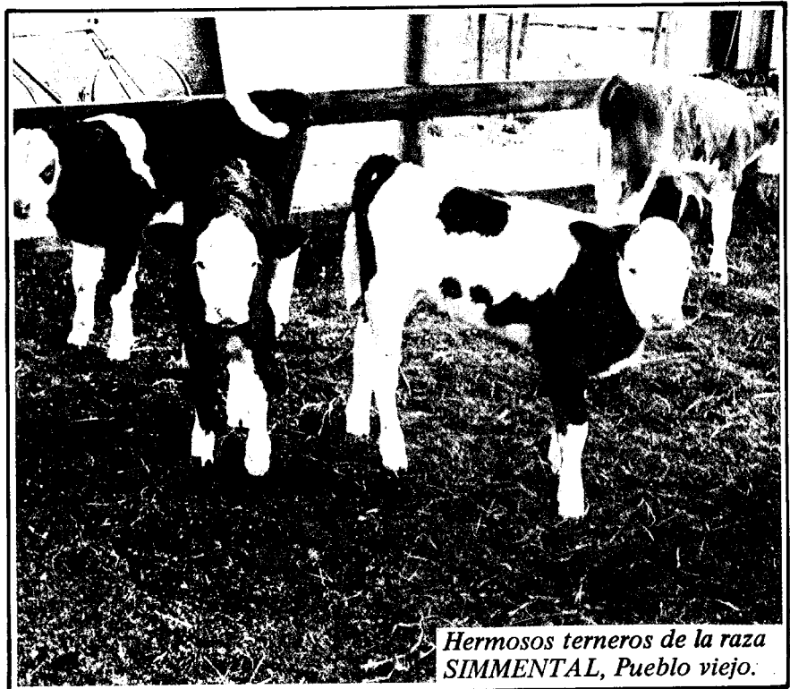
Hermosos terneros de la raza SIMMENTAL, Pueblo viejo.

Como hasta ahora no hay una población representativa no puede hablarse de longevidad.