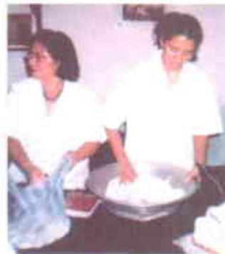
Mezcla de Azúcar

Para un kilo de licor de cacao, se adicionan dos kilos y medio de azúcar entera, más dos kilos y medio de azúcar pulverizada.