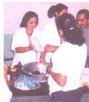
Amasar la mezcla de cacao y azúcar.