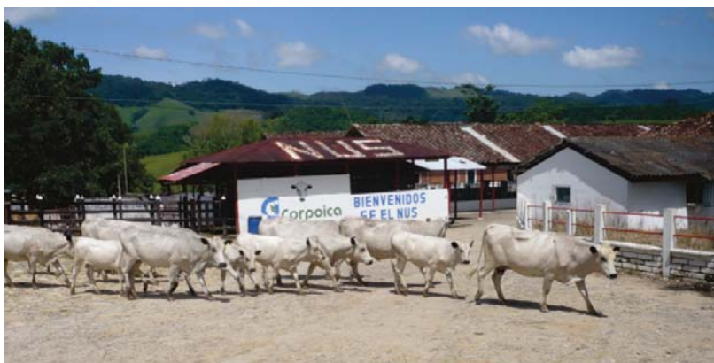
Foto 10.1. Población de hembras de la raza BON perteneciente al Banco de Germoplasma situado en el C.I. El Nus de Corpoica, municipio de San Roque, Antioquia.

Como se puede apreciar, para la raza BON el 51% de las hembras tiene valores genéticos negativos para peso al nacimiento (Hembras 72/141), mientras que el restante 49% (69/141) presenta valores genéticos positivos, similar a lo encontrado para los machos [49% negativos (51/104) y 51% de animales positivos (53/104)].