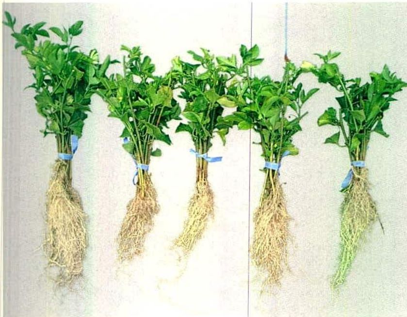
Figura 6. Estacas o esquejes enraizados de gulupa durante 50 días.