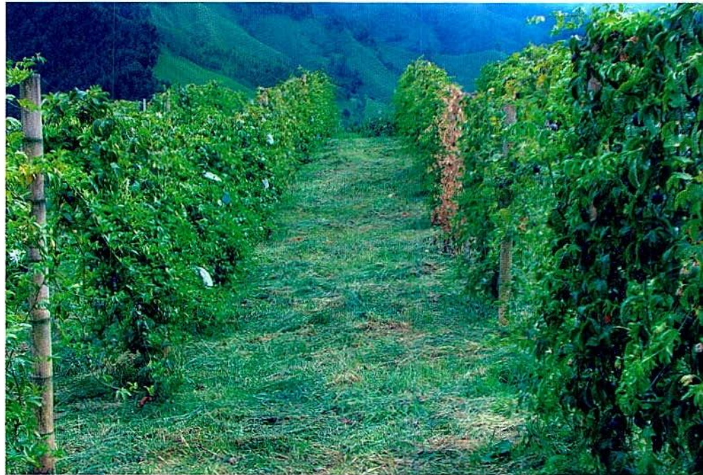
Figura 1. Cultivo de gulupa establecido en el sistema de espaldera sencilla y en pendiente moderada.

El cultivo de la gulupa carece de información consistente sobre su ecofisiología y la mayor parte de esta ha sido extrapolada de los cultivos del maracuyá y la granadilla. Por esta razón, se ha recopilado información primaria de 42 cultivos georeferenciados en las principales zonas productoras del país, y con la ayuda de bases de datos climáticos (bioclima) y analizados en el programa