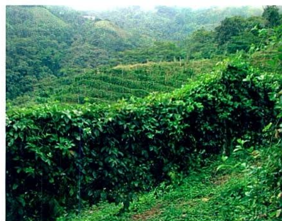
Figura 4. Cultivo de gulupa establecido cerca a zonas boscosas en el departamento de Caldas.