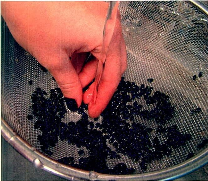
Figura 1. Remoción del mucílago o arilo de la semilla de la gulupa.