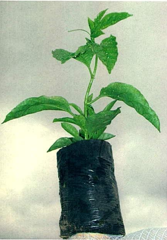
Figura 3. Semillero de gulupa directamente sobre bolsa plástica.

polietileno (15 x 9 cm) o en bandejas plásticas con turba (12 x 4 cm) 1 o 2 semillas espaciadas entre sí y a una profundidad de 1 cm, para después eliminar la de menor vigor (Figura 4). El trasplante al sitio de siembra puede ser entre 60 a 65 días después de la siembra, cuando la plántula alcanza 20 a 25 cm de altura o la aparición del primer zarcillo. Es recomendable realizar el trasplante al inicio de las épocas de lluvias, en caso que no se disponga de un sistema de riego que garantice un buen desarrollo al inicio del cultivo.