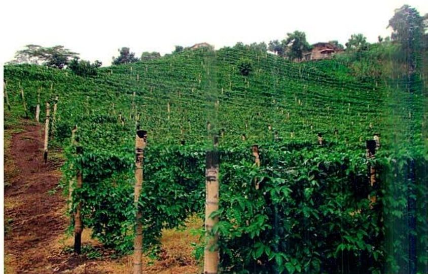
Figura 2. Cultivo de gulupa establecido en una pendiente del 100%.

La gulupa requiere suelos con textura liviana, de franco arenosos a franco arcillosos, buen drenaje, profundidad efectiva de \geq 60 cm, buen contenido de materia orgánica ( \geq 5\% ) y minerales (Angulo, 2009). El pH puede oscilar en 6 a 7 con un óptimo de 6,5 para un buen desarrollo de la planta (Peasley et al. , 2006; Jiménez et al. , 2009). La pendiente de los suelos no es un factor muy limitante para el cultivo de la gulupa, y se recomienda suelos con pendientes no mayores al 100% (45°) que faciliten las labores culturales y una buena evacuación del agua (Figura 2). Las características texturales y de fertilidad del suelo es un factor importante para un buen desarrollo de las plantas y se recomienda realizar un análisis físico-químico que permita manejar los excesos y