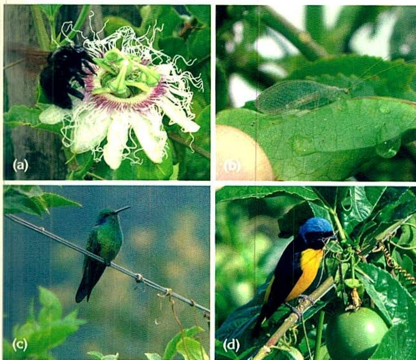
Figura 3. Diversidad biológica de algunos organismos asociados al cultivo de gulupa en Colombia: (a) insecto polinizador ( Xylocopa sp.), (b) controlador biológico ( Chrysopa sp.), (c) aves nectaríferas, colibrí ( Colibri thalasinus (Swainson)) y (d) aves visitantes ( Euphonia cyanocephala (Vaccillot)).

productivos se localizan en un rango altitudinal entre 1.700 a 2.200 msnm, cerca de las zonas boscosas (Figura 3). Dentro de estos organismos, se encuentran los insectos polinizadores ( Xylocopa sp.) y los controladores biológicos como las crisopas ( Chrysopa sp.). En las aves se destacan los colibríes, los cuales se alimentan del néctar de las flores y a su vez usan el sistema de tutorado para la construcción de sus nidos. La interacción entre estos animales y el agroecosistema contribuye a la preservación de la diversidad biológica en las zonas donde están establecidos los cultivos (Figura 4). Sin embargo, la presencia de ellos depende del manejo agronómico del cultivo y en especial con las aplicaciones racionales de los plaguicidas y la adopción de las Buenas Prácticas Agrícolas (BPA).