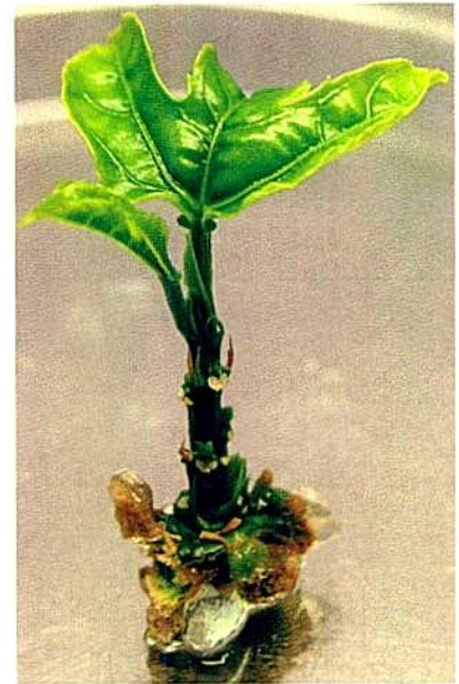
Figura 7. Plántula de gulupa proveniente de cultivo in vitro . Foto: cortesía de Diana Ortiz, (UNAL Bogotá).

La propagación in vitro se hace a partir de yemas provenientes de los ápices de ramas secundarias y sembradas en un medio nutritivo preestablecido y bajo condiciones asépticas de laboratorio. Esta técnica ha mostrado ventajas comparativas con otros sistemas de propagación vegetativa, permitiendo una producción clonal masiva y rápida de plantas seleccionadas (Figura 7). Además, permite un mayor control sobre la sanidad del material y obtener plantas libres de patógenos como virus y bacterias que tanto afectan el cultivo de la gulupa. El cultivo de tejidos en la gulupa es relativamente nuevo y son pocos los trabajos de investigación sobre este tipo de micropropagación, además esta tecnología aún no ha sido muy difundida entre los productores (Ortiz & Suárez, 2008; Parra et al. , 2011).