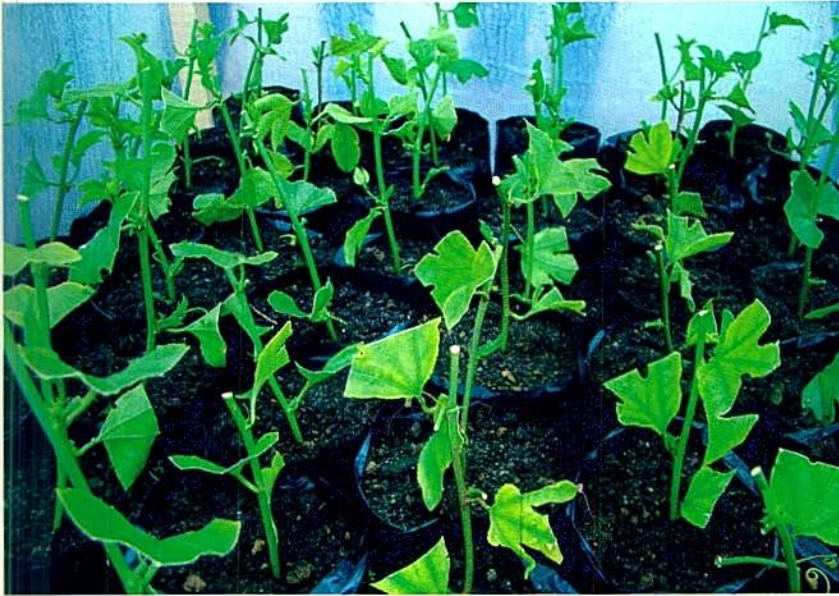
Figura 5. Propagación vegetativa de la gulupa por medio de estacas.

(Figura 5). Las estacas deben permanecer entre 45 y 55 días en el almácigo con una buena humedad y con polisombra, evitando la luz directa del sol, lo cual asegura un elevado porcentaje de supervivencia y enraizamiento, para posteriormente ser llevadas a campo (Figura 6).