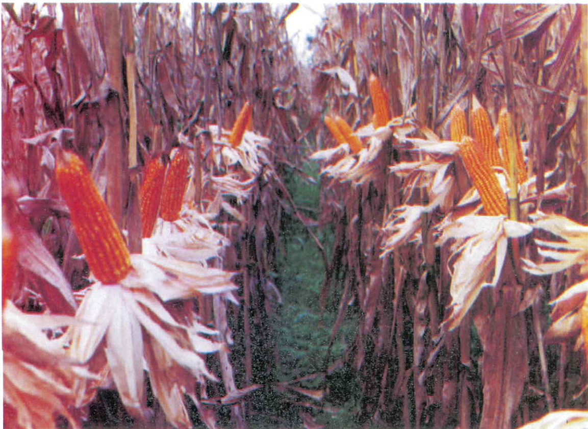
Tipo de planta baja con buena inserción de mazorca y alta uniformidad.

Presenta granos semicristalinos de color amarillo-naranja, floración femenina a los 50 días, altura promedio de planta y mazorca de 235 y 120 cm. respectivamente, consideradas baja, lo cual es de mucha importancia en zonas con fuertes vientos como lo es el Valle del Sinú, por su resistencia al volcamiento. En diferentes localidades del Valle del Sinú este híbrido simple a presentado producciones promedios de 4.8 a 7.0 t/ha de grano con un 15% de humedad (Tabla 1).