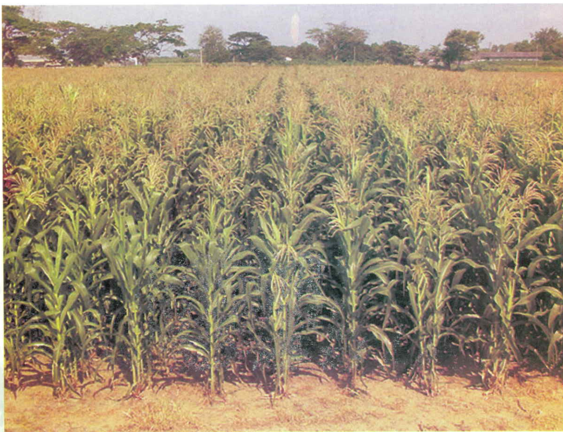
Aspecto de lote semicomercial del híbrido CORPOICA TURIPANA H - 112