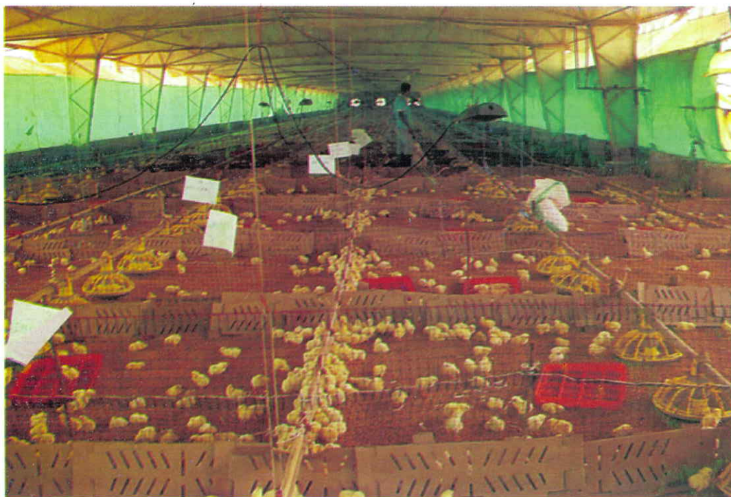
Ensayo de pollos de engorde. Granja avícola Malula Avites S.A

Como puede observarse las dietas que incluyen en el maíz CORPOICA TURIPANÁ H-112 registran los costos $/tonelada más bajos, dado el perfil nutricional mejorado del mismo respecto al maíz amarillo Nacional y Americano Grado 2. Los tres diferentes maíces se corrieron sobre el mismo costo, el cual fue de $400.000/tonelada.