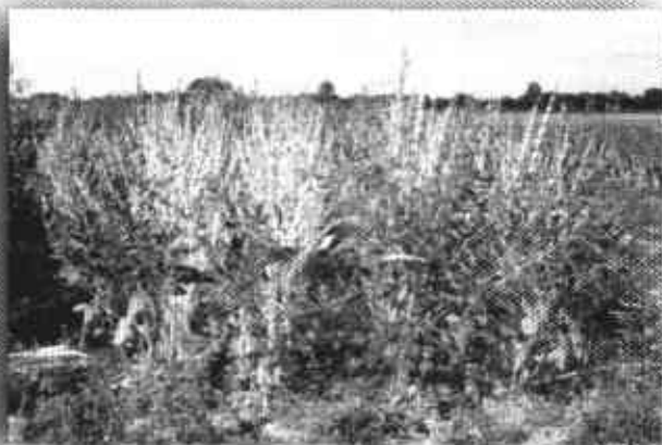
Foto 7. Edad de corte del cultivo del ajonjolí.