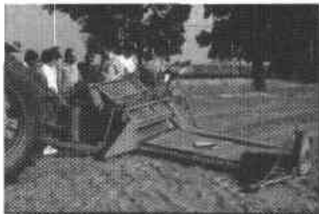
Foto 14. Segadora atadora de ajonjolí.