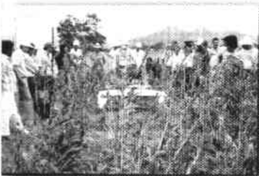
Foto 10. Secadora amarradora en ajonjolí.