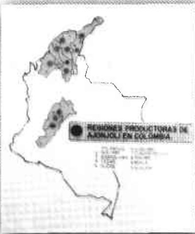
Foto2. Zonas de producción del cultivo de ajonjolí en Colombia.