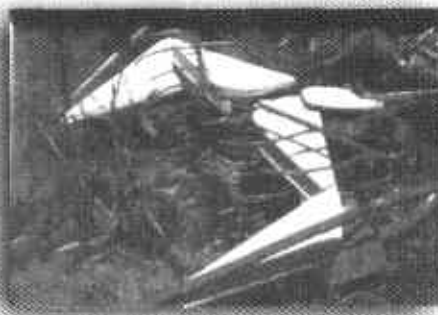
Foto 9. Segadora amarradora en ajonjolí.