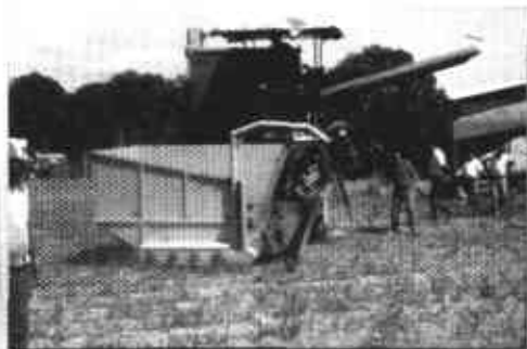
Foto 16. Trilladora de ajonjolí con alimentación de los urones en forma mecánica (pescozón).