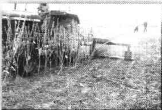
Foto 12. Segadora lateral acoplada al tractor.