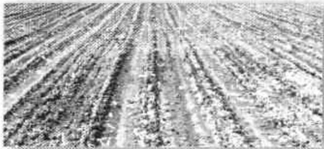
Foto 6. Densidades de población de plantas de ajonjolí.