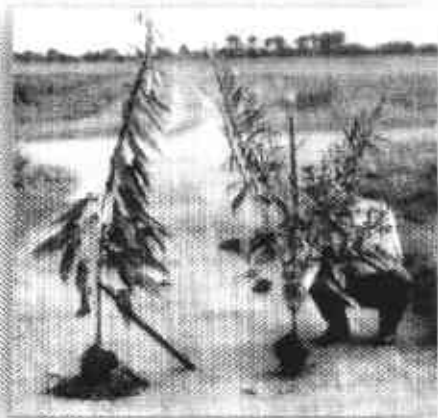
Foto 5. Tipos de plantas de ajonjolí de acuerdo con la ramificación.