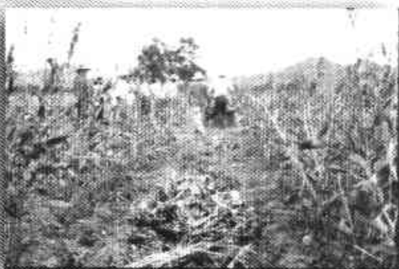
Foto 11. Secadora amarradora en ajonjolí.