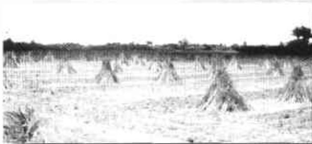
Foto 8. Urones de ajonjolí.