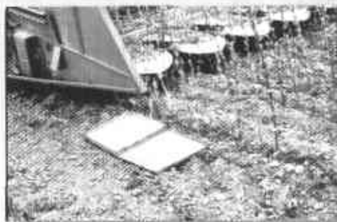
Fotos 17 y 18. Combinada con cabezal para trilla directa de ajonjolí.