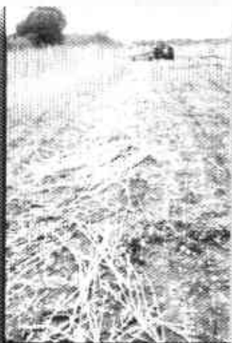
Foto 13. Segadora lateral acoplada al tractor.