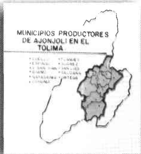
Foto3. Zonas de producción del cultivo de ajonjolí en el departamento del Tolima.