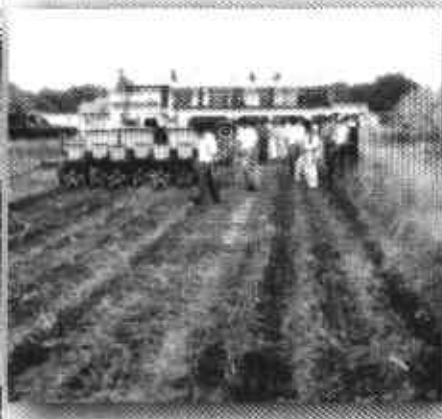
Foto 4. Sistema de siembra directa.