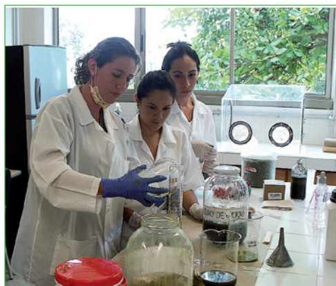
Montaje del proceso de digestión anaerobia para BF

Los residuos lignocelulósicos son sustratos aptos para ser tratados por sistemas de digestión anaerobia; sin embargo pueden llegar a ser resistentes a la bioconversión, debido a que