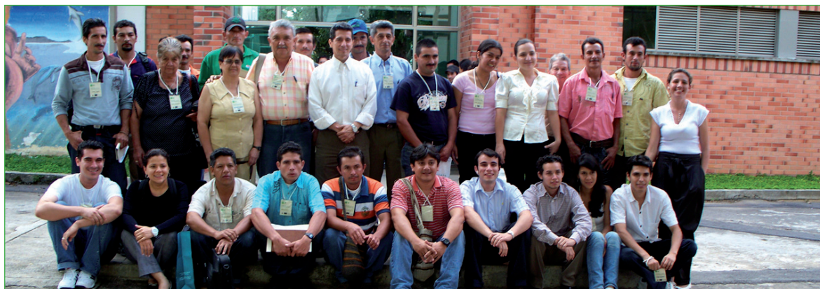
Integrantes de la alianza

Se evaluaron siete consorcios microbianos independientes que incluyeron: Líquido Ruminal (LR) y Estiércol Bovino (EB) recolectados en el frigorífico municipal (Bucaramanga, Colombia), Lodo Anaerobio (LPTAR) obtenido de una planta de tratamiento de aguas residuales (Floridablanca, Colombia), Estiércol de Porcino (EP) recolectado en una porcícola municipal (Los Santos,