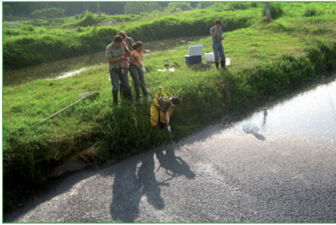
Recolección de muestra del LC