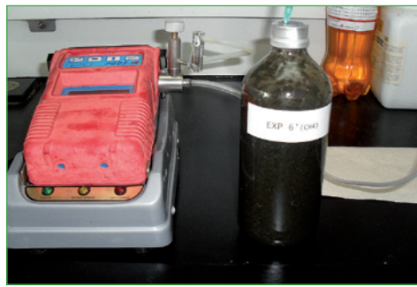
Montaje de la técnica de medición de porcentaje de metano

Colombia). Además se evaluó la co-digestión entre los consorcios LR+EB, LR+EP y LR+LPTAR.