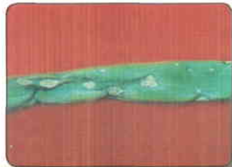
Heterosporium alli en cebolla de rama

Para el manejo de esta enfermedad se recomienda no descuidar el buen manejo del cultivo, de modo que las plan-