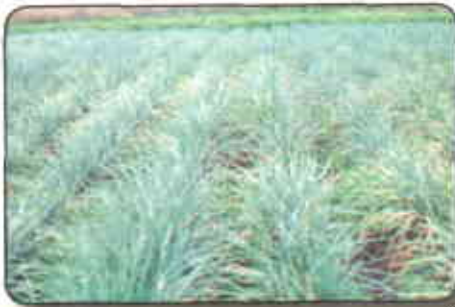
Cultivo bien fertilizado

8 y 15 días, posteriormente es picado dentro de los surcos, donde se deja reposar durante un largo período de tiempo con una posible pérdida de nutrientes (especialmente nitrógeno y potasio) por volatilización y lavado.