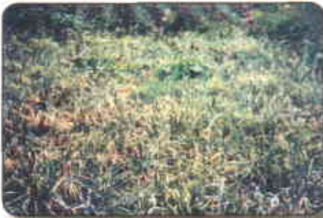
Estado avanzado de ataque por Cladosporium alli

tas crezcan con buena fertilidad, riego adecuado, manejo de malezas, etc.