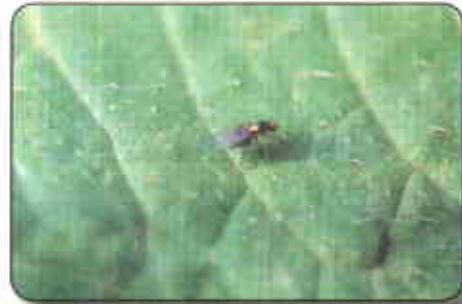
Adulto del minador Liriomyza huidobrensis

Liriomyza huidobrensis . Su metamorfosis incluye los estados de: huevo, larva, pupa y adulto. Estos últimos son mosquitos pequeños de color gris oscuro con manchas amarillas en la cabeza y el tórax, viven hasta un mes y ponen cientos de huevos durante este tiempo. Las larvas son las que ocasionan daño económico al construir minas y galerías en las hojas, llegando a secar las hojas. El manejo de estos insectos incluye el control de las malezas huéspedes, el uso de trampas pegantes de color amarillo para recolectar los adultos y el control químico dirigido a los adultos con productos a base de cyromazina (30-40 gr p.c./ha) o dimetoato (0,5-0,7 lt p.c./ha).