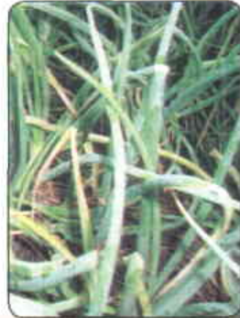
Ataque de Alternaria porri

Las pautas de manejo de la enfermedad están dirigidas a la eliminación total de los residuos de cada corte, evitar el exceso de humedad en el lote o los riegos demasiado frecuentes. Se sugiere la utilización de uno de los siguientes funguicidas, aplicados al follaje tan pronto como se observen los primeros síntomas: clorotalonil (1-2 Kg i.a./ha), iprodione (0,3 Kg i.a./ha) o mancoceb (1-2,6 Kg i.a./ha).