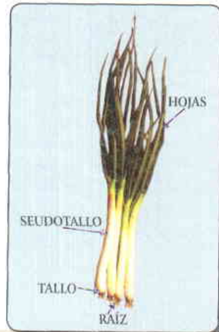
Partes fundamentales de la estructura de la cebolla de rama

El tallo, que se encuentra por de bajo del nivel del suelo, se aplana para formar un disco en la base de la planta y así permanece a menos que se produzca la floración, entonces el meristemo del ápice caulinar se desarrolla para dar origen a la floración. En la parte