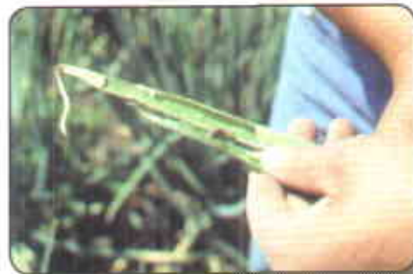
Gusano comedor de hojas