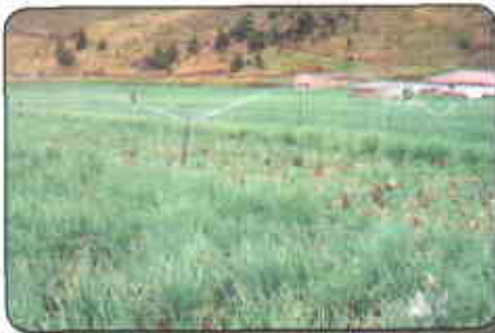
Riego por aspersión

La actual inestabilidad de los ciclos de lluvias y los grandes requerimientos de agua del cultivo para realizar los procesos metabólicos para su crecimiento y desarrollo, hace imprescindible aplicar riego.