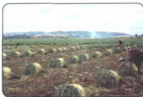
Cosecha y empaque en ruedas

Para la venta en supermercado, la cebolla es empacada en mallas de polipropileno y en cada una de ellas se coloca un kilo del producto, esto es aproximadamente 15 gajos. El acondicionamiento en este caso consiste en el corte de la raíz, la limpieza o descalcetado, el corte parcial del follaje y el empaque.