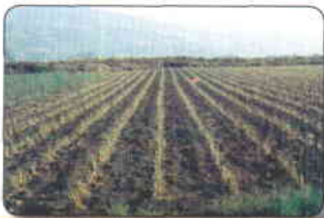
Cebolla a los 20 días de sembrada