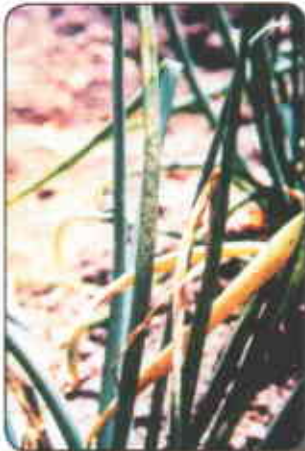
Cebolla de rama afectada por mildew veloso

climáticas y meteorológicas determinan la incidencia y severidad del ataque siendo favorecido por cambios bruscos de temperatura, alta humedad relativa y rocíos frecuentes. Cuando las condiciones climáticas son favorables para el desarrollo de la enfermedad, aparece sobre las hojas una cubierta grisácea que luego se vuelve oscura; si las condiciones ambientales cambian, la hoja se dobla por el punto infectado y se seca desde allí hasta el ápice. La enfermedad se caracteriza por lesiones elípticas grandes a lo largo de la hoja, de tamaño variable de 1 a 10 centímetros de longitud. El patógeno penetra a la planta por los estomas y para que las semillas del hongo (conidios) germinen, la superficie de la hoja debe permanecer mojada durante 3 a 4 horas con temperaturas de 6 a 10 °C. El mildew veloso es una enfermedad muy severa, la cual puede causar grandes pérdidas económicas; aunque no es la de mayor importancia en el área total sembrada por estar confinada a lugares que cumplen con las condiciones climáticas para su desarrollo.