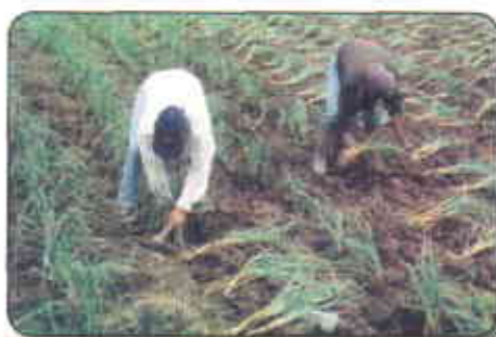
Siembra. Parado de gajos