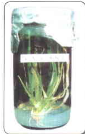
Cultivo de cebolla de rama in vitro