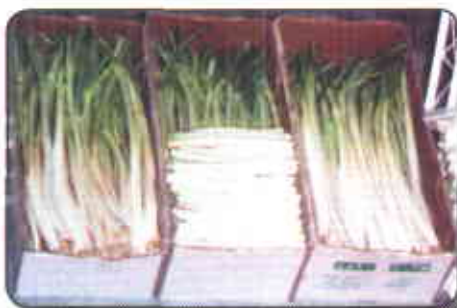
Empaque en cajas de cartón

Para la venta en supermercado, la cebolla es empacada en mallas de polipropileno y en cada una de ellas se coloca un kilo del producto, esto es aproximadamente 15 gajos. El acondicionamiento en este caso consiste en el corte de la raíz, la limpieza o descalcetado, el corte parcial del follaje y el empaque.