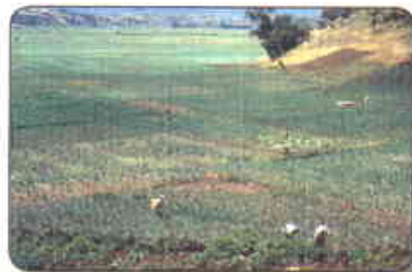
Sistema de producción escalonado

En la Tabla 1 aparecen detallados esos costos. En ella se aprecia que el uso de insumos demanda la mayor inversión tanto en la fase de establecimiento (65%) como en la de mantenimiento (52.6 %) y si se examinan los niveles porcentuales correspondientes a los diferentes insumos que conforman este componente, se encuentran situaciones diferentes comparando la de establecimiento con la de sostenimiento del cultivo: en la primera, más del 50% de los costos están explicados por el monto que se dedica a semilla y a fertilizantes orgánicos, mientras que en ese mismo sentido en el sostenimiento pierde importancia la semilla destacándose en primer lugar los fertilizantes con un peso relativo del 34%, en segundo lugar están los fungicidas. En lo relativo a mano de obra, se estimó un total de 165.5 jornales /ha para el primer ciclo del cultivo y en 107 jornales/ha para las labores de un período de sostenimiento. En términos de costos, esto significa que en el primer caso se destina el 23% de los costos totales al pago de mano de obra y en el segundo caso un poco más del 26%. Las actividades que más requieren del factor trabajo son las correspondientes a la cosecha