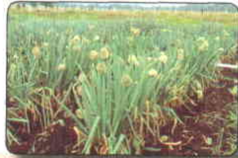
Plantas indeseables (Florecidas)

Un buen material debe tener características relacionadas con las exigencias del mercado como son las relacionadas con apariencia y calidad; específicamente el pseudotallo por ejemplo debe ser amarillo dorado o pardo rojizo, con buena pungencia o picante, textura firme y buena longitud.