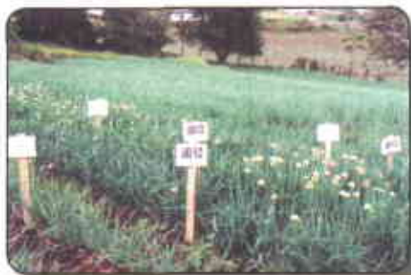
Evaluación de materiales (clones)

a Aquitania clones del Banco Nacional de Germoplasma con la finalidad de evaluarlos para identificar aquellos que tengan mejores características de adaptación a la zona y que se destaquen por sus buenas características agronómicas, ren-