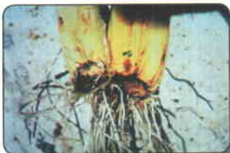
Síntomas producidos por el ataque de Ditylenchus dipsaci

que se utilizan como semilla y esta constituye un factor de contagio y diseminación del problema. La extrema humedad del suelo es igualmente fundamental para la infección y perpetuación del nematodo en el suelo.