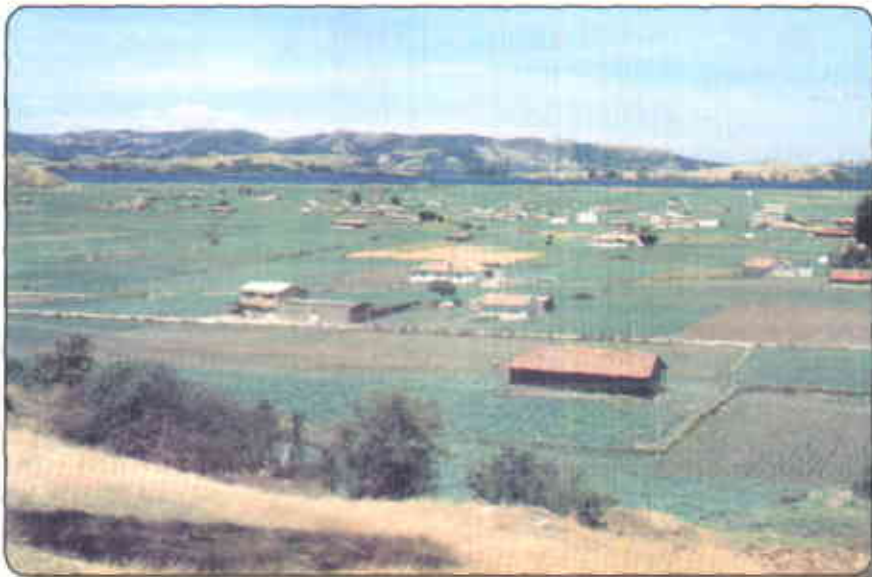
Panorámica de los cultivos de cebolla en Aquitania (Boyacá)

Entre los principales factores para el éxito de este cultivo se encuentra el tipo de suelo, el cual va de franco a franco arcilloso, buena profundidad efectiva, con un contenido de materia orgánica de medio a alto y con un pH entre 6.0 y 7.0.