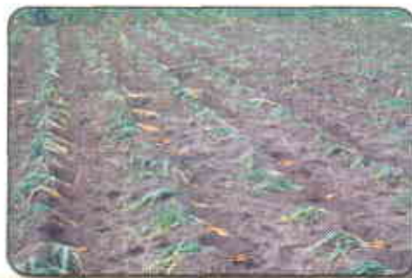
Siembra. Ahoyada y colocación de gajos

A lo largo de los surcos, trazados previamente, se procede a abrir huecos a la distancia acordada y en ellos se colocan de tres a cuatro gajos, posteriormente se paran los gajos arrimando tierra para llenar el hueco. Al mes de sembrar, se hace el llamado aporque, que consiste en arrimar tierra a la cebolla, aprovechando esta operación para aflojar la tierra y desyerbar.