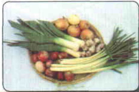
Especies del género Allium

Con anterioridad, diferentes autores habían incluido las Alliaceae tanto en las Liliaceae como en las Amaryllidaceae, pero en la actualidad se consideran como una familia aparte. Dentro del género Allium hay más de 500 especies y a nivel nacional las más conocidas son la cebolla de bulbo, la cebolla de rama, el ajo, el puerro y el cebollino.