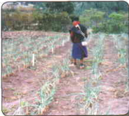
Cultivo limpio en Cauca

El manejo químico de las malezas en el cultivo de la cebolla de rama es casi desconocido porque ellas se controlan manualmente en cada uno de los dos o tres aporques. Las cebollas tienen raíces superficiales, razón por la cual se debe tener cuidado al acercar la herramienta a la planta, cuando se hacen los aporques y las deshierbas, para no causarle heridas que sirvan de entrada a patógenos causantes de enfermedades.