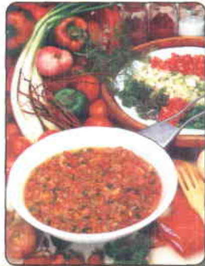
Uso de la cebolla en la preparación de comidas

La utilización tradicional de esta cebolla es como condimento para las comidas. El olor y sabor picante son producidos por los típicos compuestos azufrados de la cebolla. La mayor parte del azufre se encuentra en forma de aminoácidos no proteicos, que incluyen los precursores de los compuestos volátiles de aroma y sabor. Cuando se daña el tejido fresco de la cebolla, estos precursores reaccionan bajo el control de la enzima allinasa, liberando ácidos sulfénicos, más amoníaco y piruvato. La enzima está confinada en las vacuolas celulares, mientras que los precursores del aroma y el sabor lo están en el citoplasma, probablemente en el interior de las pequeñas vesículas que se asocian a su presencia en la célula. De aquí que la enzima tenga acceso como señales para localizarlos, como su-