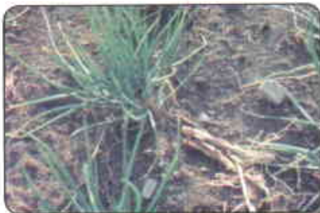
Plantas arrancadas y dejadas en el lote

El manejo de esta plaga se hace a través del uso de semilla libre del nematodo, evitando encharcamientos en el lote y la completa eliminación de los residuos de cosecha. Se sugiere aplicar etoprofos (135-180 Kg p.c./ha).