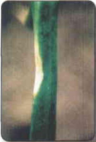
Estado inicial de ataque por Cladosporium alli