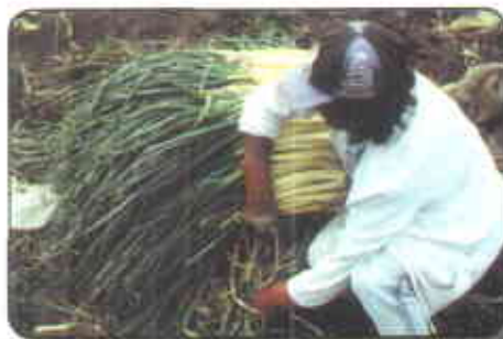
Hechura de ruedas

La llamada rueda (la “grande” de 50 kilos y la “pony” de 25 kilos), es una forma de empaque del producto imperante en Aquitania desde hace unos años y que reemplazó al llamado bulto (acomodamiento de la cebolla en costales). A raíz de nuevas exigencias de Corabastos, el principal centro de acopio de Colombia, se están probando nuevos tipos de empaques tendientes a contener lo menos posible desechos de tierra y material vegetal. Cuando la cebolla de rama va dirigida al mercado mayorista, su manejo poscosecha es mínimo y se limita al corte de raíces, armado de la rueda, lo cual incluye el descalcete de algunas cebollas y el doblado de unos gajos para colocarlos en la parte media de la rueda y así darle forma.