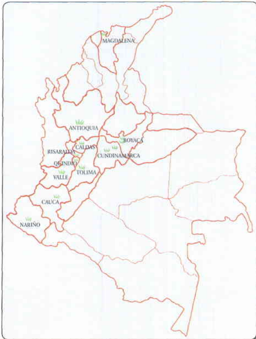
Principales departamentos productores de cebolla en rama

La cebolla de rama ( Allium fistulosum ) y su cultivo