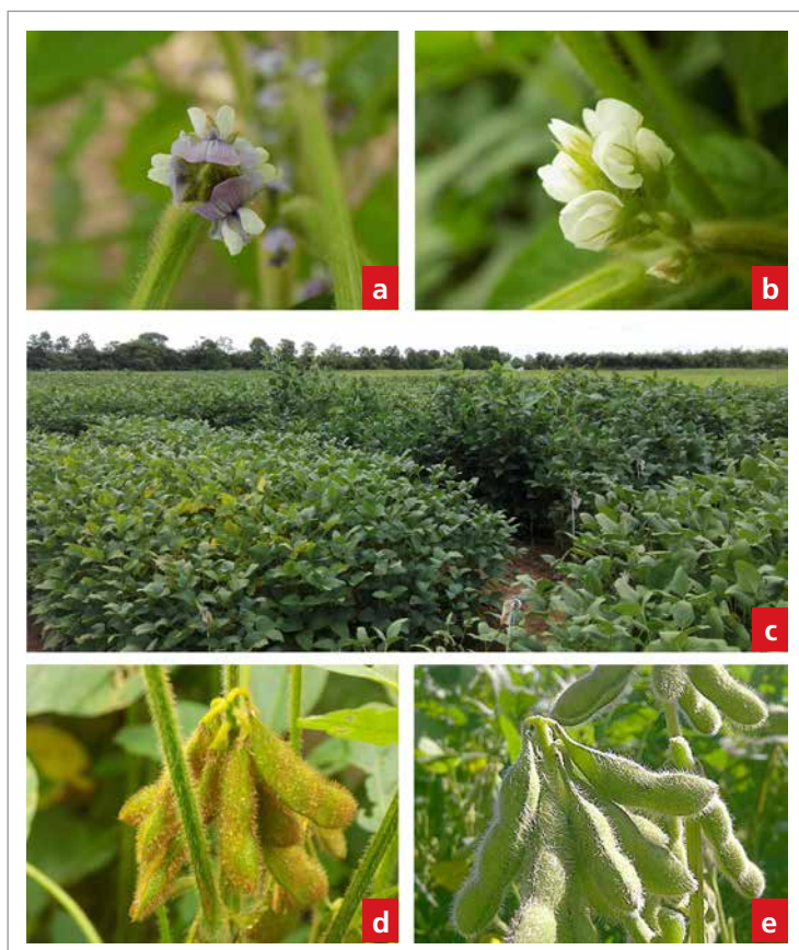
Figura 5. Características fenotípicas de color de flor, hábito de crecimiento y color de pubescencia en plantas de soya. a. Flor de color púrpura; b. Flor de color blanco; c. Hábitos de crecimiento determinado e indeterminado; d. Pubescencia color café; e. Pubescencia color gris.

Con el objetivo de garantizar la pureza genética, se deben eliminar las plantas fuera de tipo de acuerdo con las fichas técnicas del obtentor de la variedad. Esta labor debe realizarse, antes de la floración, por diferenciación en el color del hipocótilo y por la forma de la lámina foliar; durante la floración, por el color de las flores, el hábito de crecimiento y el ciclo vegetativo, y en madurez fisiológica y cosecha, por el color de la pubescencia y por el ciclo de vida (figura 5). La eliminación de plantas atípicas debe realizarse tantas veces como se considere pertinente, a fin de asegurar la calidad final de la semilla. En cuanto a la certificación, se rechaza un lote en el cual se encuentre más de un 1 % de plantas atípicas que estén o hayan estado en etapa reproductiva.