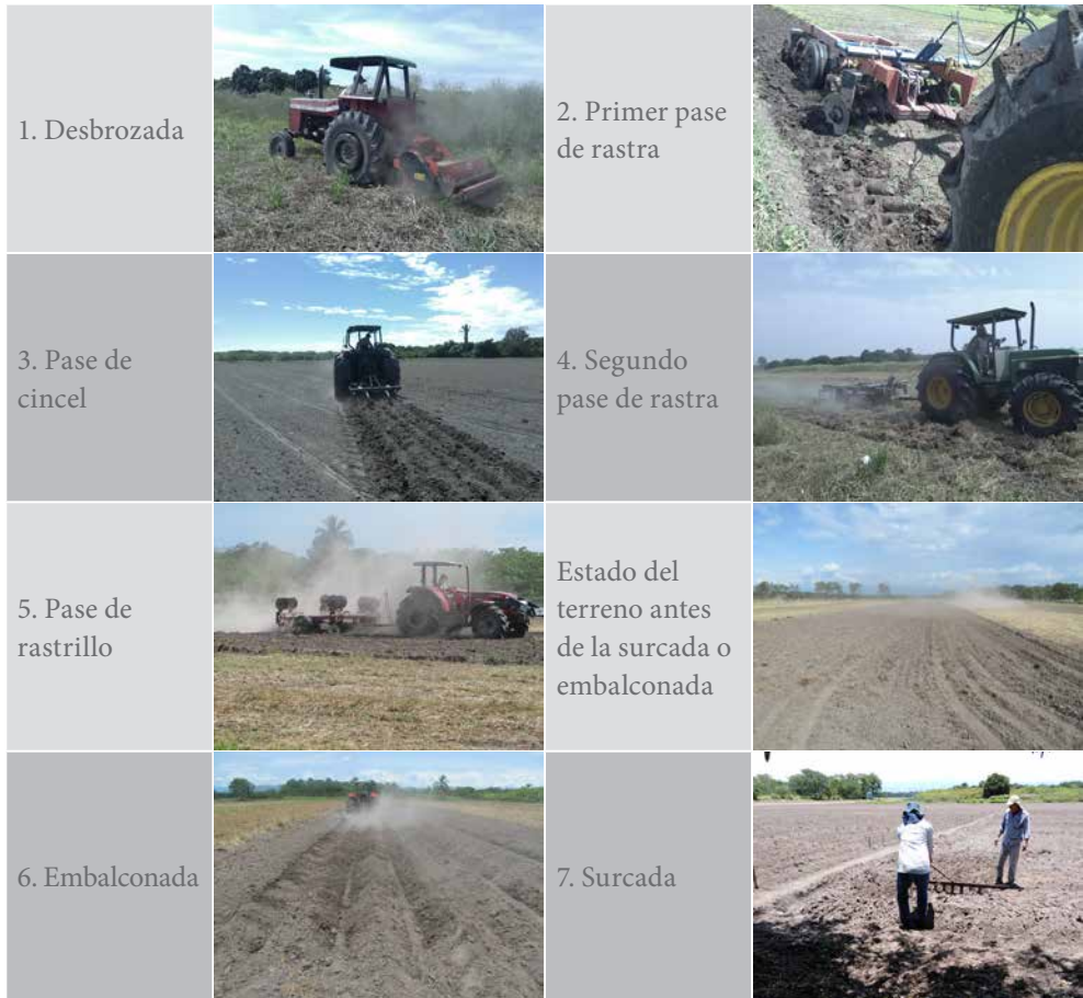
Tabla 3. Actividades de preparación del suelo para la siembra de soja en los valles interandinos

Fernández (2013) hizo un estudio del departamento del Tolima en cuanto al aspecto climático y encontró las siguientes características: régimen bimodal de la precipitación, con dos temporadas de lluvias al año: abril-mayo y octubre-noviembre, y dos temporadas secas: enero-febrero y julio-agosto. En Purificación y Chicoral se presentan lluvias anuales de entre 1.000 y 1.500 mm. En ambos lugares, la clasificación de la temperatura corresponde a cálida, con una mínima promedio de 22 °C y una máxima promedio de 32 °C.