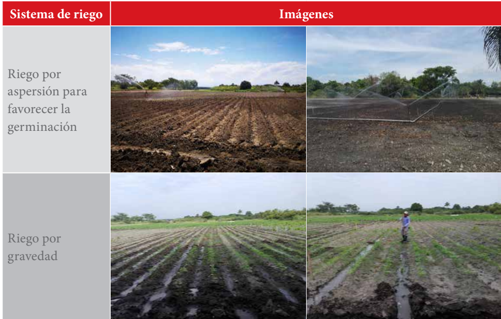
Tabla 4. Sistemas de riego en campo para favorecer la germinación y el desarrollo del cultivo de soya en los valles interandinos