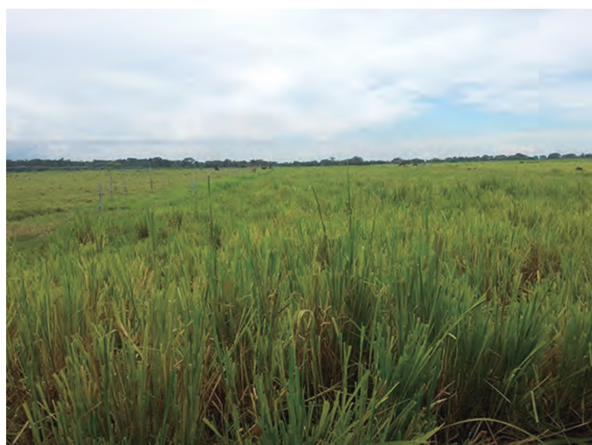
Pradera de gramíneas (Arreglo A0)

Arreglo A3: Igual que el Arreglo A2 pero incluye además las especies maderables ceiba tola -CEI- ( Pachira quinata ) y caoba -CAO- ( Swietenia macrophylla ).