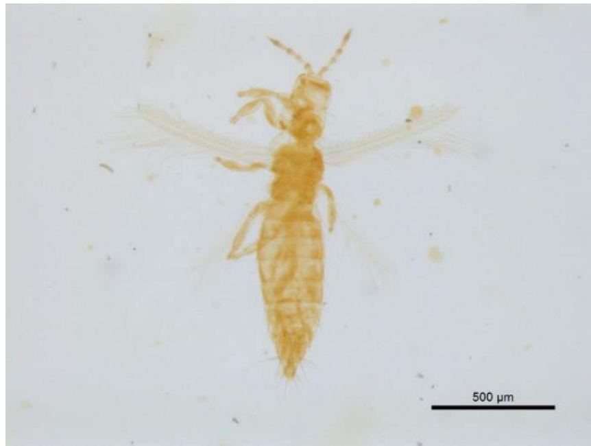
Figura 3. Espécimen de Frankliniella gossypiana Hood recolectado en inflorescencias de C. ensiformis en Coclé, Panamá.