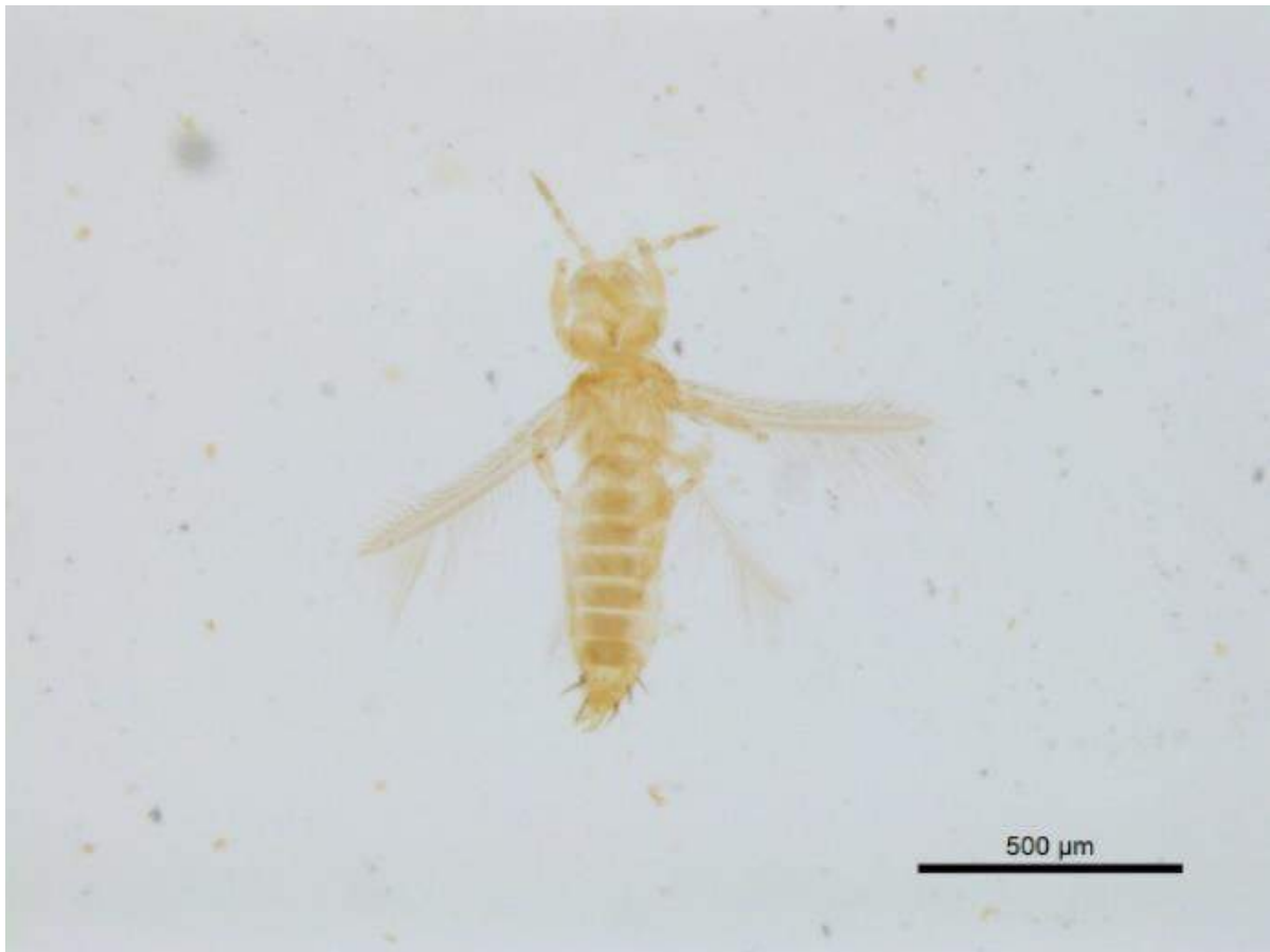
Figura 2. Espécimen de Frankliniella cephalica (Crawford) recolectado en inflorescencias de C. ensiformis en Coclé, Panamá.