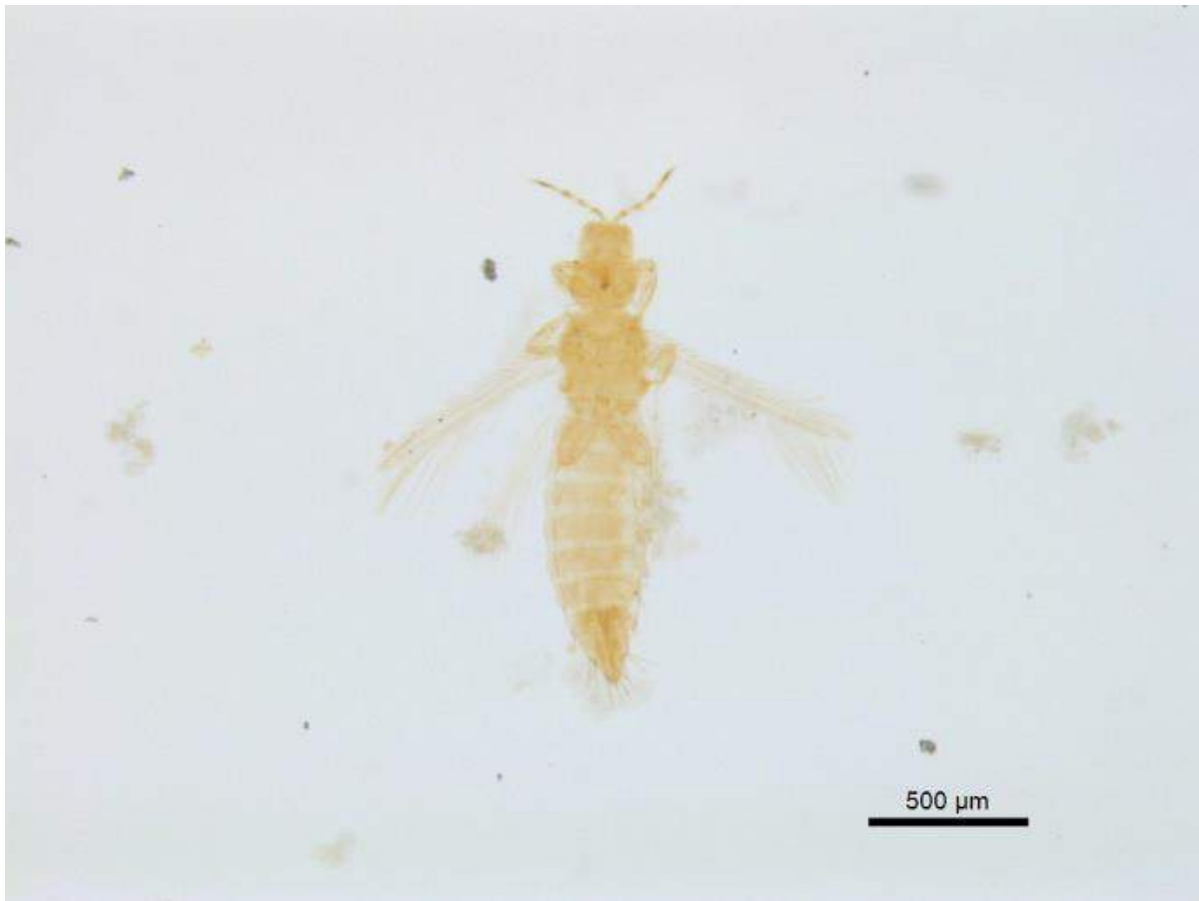
Figura 5. Especímen de Frankliniella williamsi Hood recolectado en inflorescencias de C. ensiformis en Coclé, Panamá.