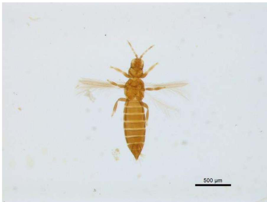
Figura 4. Espécimen de Frankliniella insularis (Franklin) recolectado en inflorescencias de C. ensiformis en Coclé, Panamá.