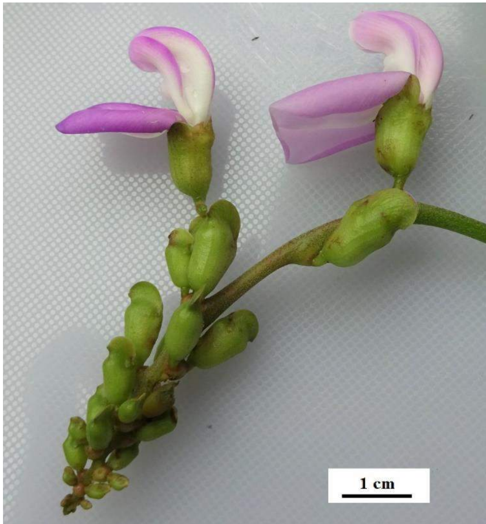
Figura 1. Flores de Canavalia ensiformis (L.)