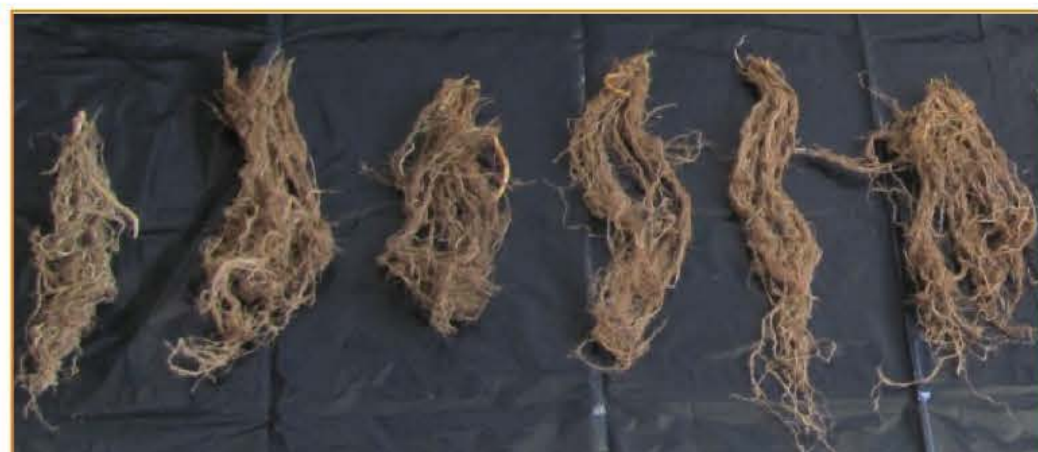
Figura 3. Longitud de la raíz de pasto kikuyo, bajo las condiciones de prueba. De izq-der. Testigo absoluto, testigo químico, K24, K32, KA206 y K35.