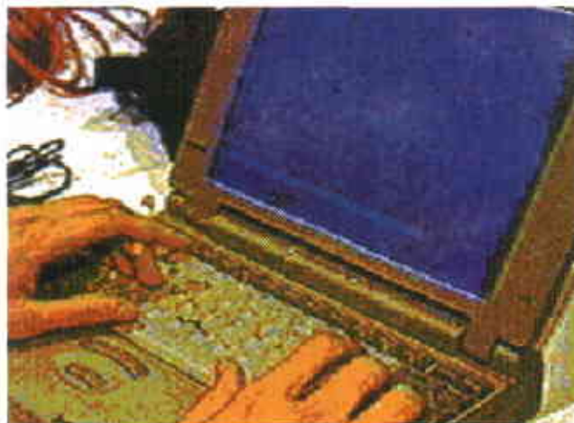
Figura 3. La introducción de los datos en el computador mediante el monitoreo técnico- económico favorece el manejo de la empresa ganadera y el análisis de la información.

en una necesidad. Valga aclarar que el monitoreo ganadero es una herramienta para hacer gestión, pero no es gestión empresarial.