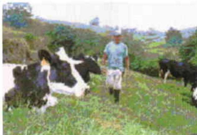
Figura 1. La gestión ambiental pretende el uso racional de los recursos naturales en el trópico.

En los sistemas de producción guiados por la calidad de los procesos, la gestión ambiental es un aspecto de mucha relevancia, ya que su consideración estratégica conduce al posicionamiento en mercados especializados.