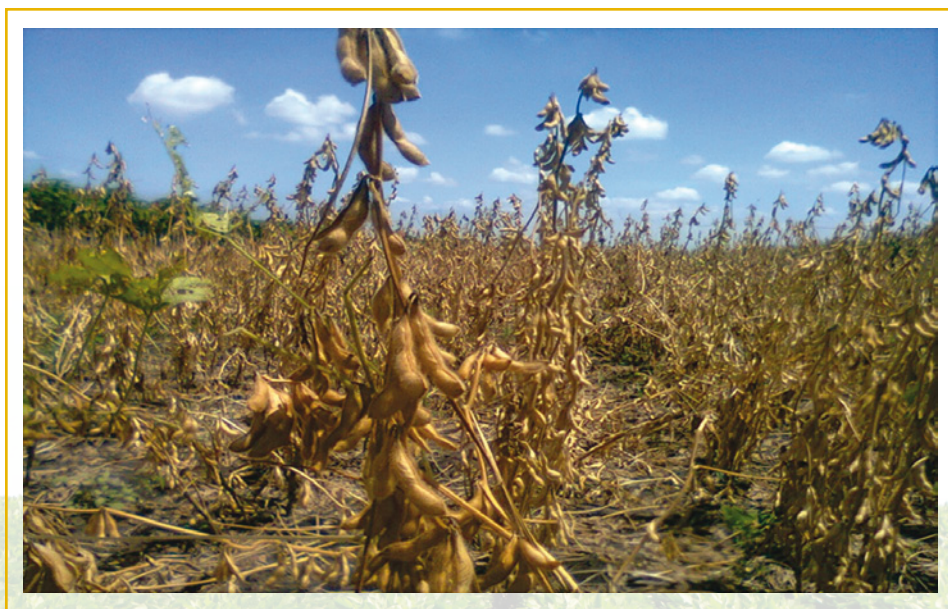
Figura 3. Evaluación de la variedad Corpoica Palmira 4 en prueba comercial

* Área de siembra en Toro por agricultor para Soyica P-34 (20,0 ha) y Palmira 4 (1,0 ha). En Palmira 2.500 m 2 para ambas variedades.