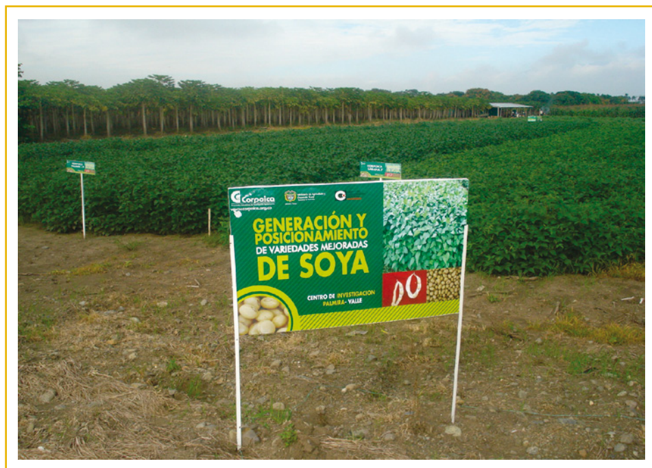
Figura 2. Panorámica de prueba semicomercial de soya en Palmira

Las variedades Corpoica Taluma 5 y Orinoquia 3 presentaron baja adaptación y rendimiento en los semestres iniciales, siendo descartadas por el agricultor porque le causaban pérdidas económicas en su explotación comercial.