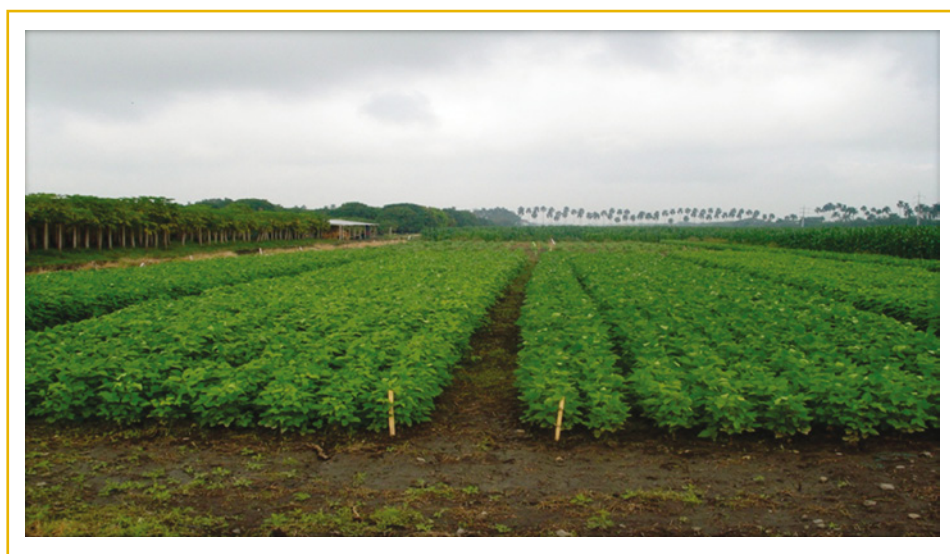
Figura 1. Lote experimental 2 del C.I. Palmira con las líneas y variedades de soya en estudio (2009 a 2011).

En la Figura 1 se ilustra el establecimiento de los materiales de soya en pruebas regionales en el lote 2 de Corpoica, C.I. Palmira.