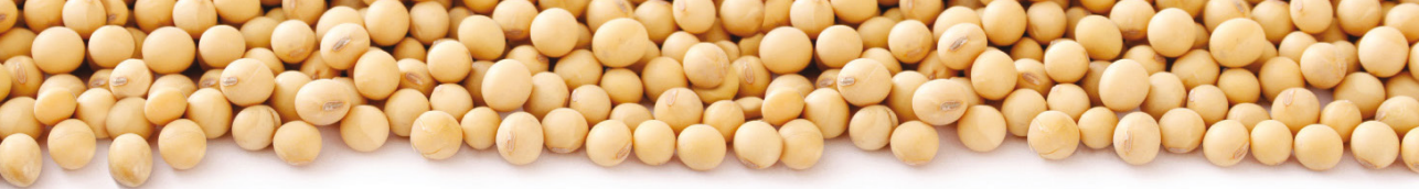
Tabla 1. Características agronómicas de líneas elites de soya. Análisis combinado del comportamiento de las variedades en dos localidades durante tres semestres. Valle del Cauca, 2009A - 2010B